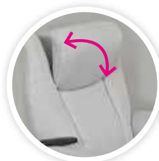
Tête réglable en inclinaison ; déport max. 13 cm. (1 moteur dédié)