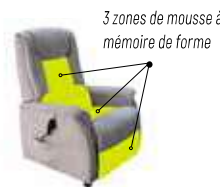
Réglage du maintien lombaire (1 moteur dédié)