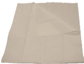
Serviette de toilette 40x85 cm Réf : 1000018137